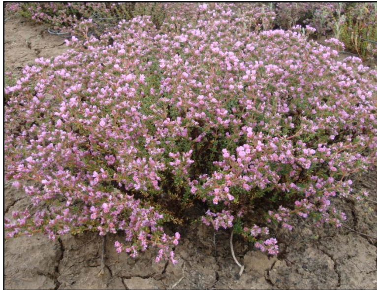
شکل ۳- نمایی از گلدهی یک بوته Frankenia hirsuta در مورخ ۱۳۸۹/۳/۱۲

ولی بهترین زمان استفاده گوسفندان از این گونه، اواخر اسفند و اوایل فروردین ماه است. نتایج بررسی کیفیت علوفه گونه F. hirsuta نشان داد که تفاوت معنی دار در میزان پروتئین خام، ماده خشک و خاکستر گیاه وجود دارد. میزان پروتئین خام در مرحله رویشی برابر با ۱۰/۳ درصد و در مرحله بذردهی ۷/۱ درصد بود، که با افزایش سن گیاه از میزان آن کاسته شد (شکل ۴) و بعکس درصد ماده خشک و خاکستر با افزایش سن گیاه افزایش پیدا کرد (جدول ۴).