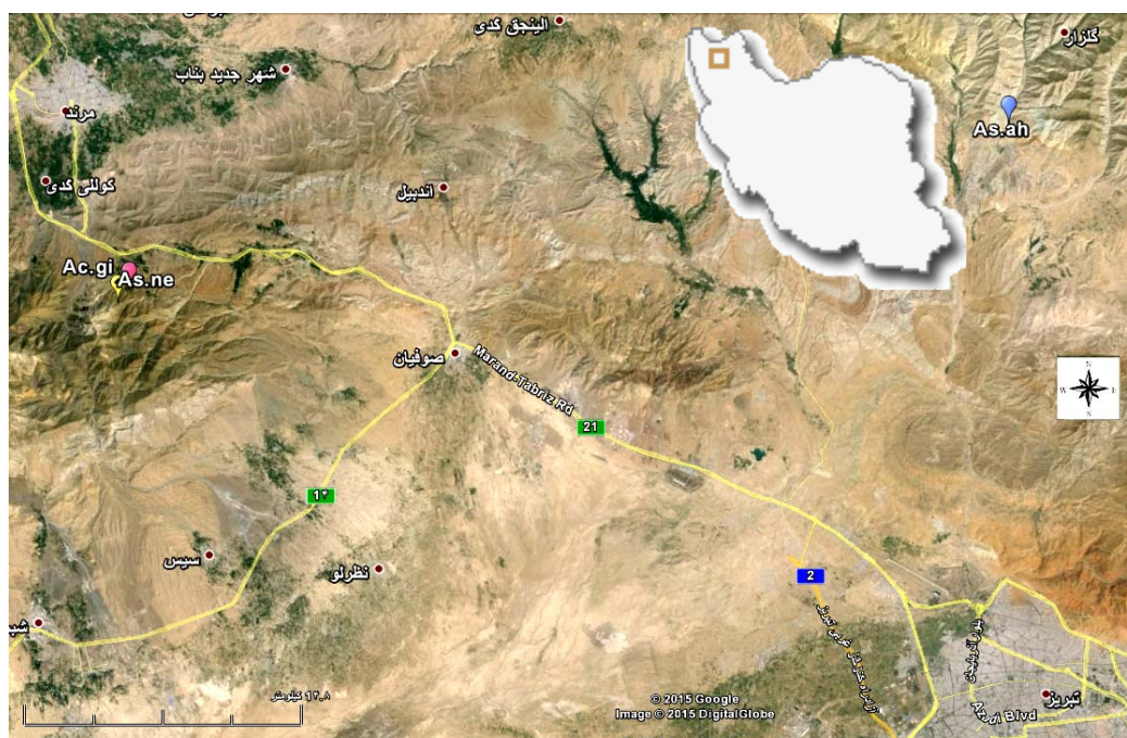
Ac.gi = Acantholimon gilliatii , As.ah = Astragalus aharicus , As.ne = Astragalus neo-mobayenii

شکل ۱- تصویر ماهواره‌ای رویشگاه گونه‌های مورد مطالعه