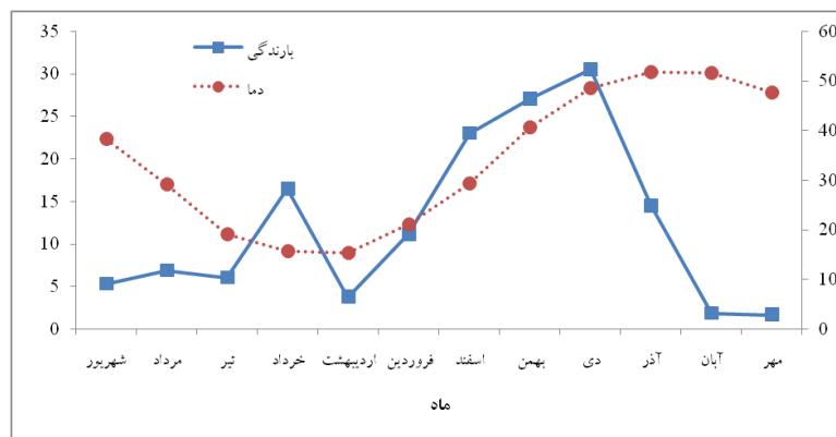
شکل ۱- منحنی آمبروترمیک منطقه صالح آباد

حاجی آباد و ۲۰۶ کیلومتری شمال بندرعباس و در بین طول‌های جغرافیایی ۵۵°۴۴' تا ۵۲°۴۸' و عرض‌های ۲۸°۳۵' تا ۲۸°۳۸' واقع شده است و جزء مراتع قشلاقی استان هرمزگان می‌باشد که مساحت آن ۲۲۵۴ هکتار است. حداکثر ارتفاع مناطق کوهستانی ۱۹۱۸ متر و حداقل ارتفاع مناطق دشتی و تپه ماهور ۱۴۶۴ متر از سطح دریا می‌باشد. به‌طور کلی منطقه دارای یک شیب کلی شمالی و جنوبی است. پراکنش بارندگی و ماه‌های خشک و مرطوب سال در منحنی آمبروترمیک (شکل ۱) نشان داده شده است. میانگین ماهانه