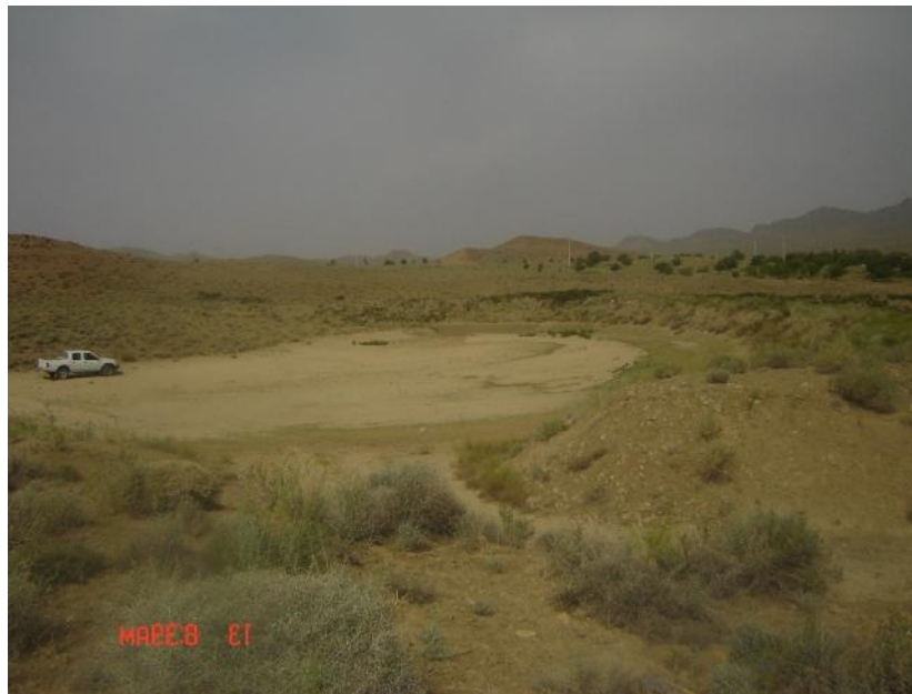
شکل ۳- نمایی از مخزن پشت بند خاکی احداث شده در حوضه

به منظور تعیین محل برای اجرای این مطالعه حوضه دره مرید از زیر حوزه‌های هلیل‌رود در استان کرمان انتخاب و سعی در جمع‌آوری گزارش‌ها و نقشه‌ها و پیشنهادهای اجرایی شد. طی بازدیدهای صحرائی که از حوضه بعمل آمد، محل‌هایی که برای عملیات بیولوژیکی