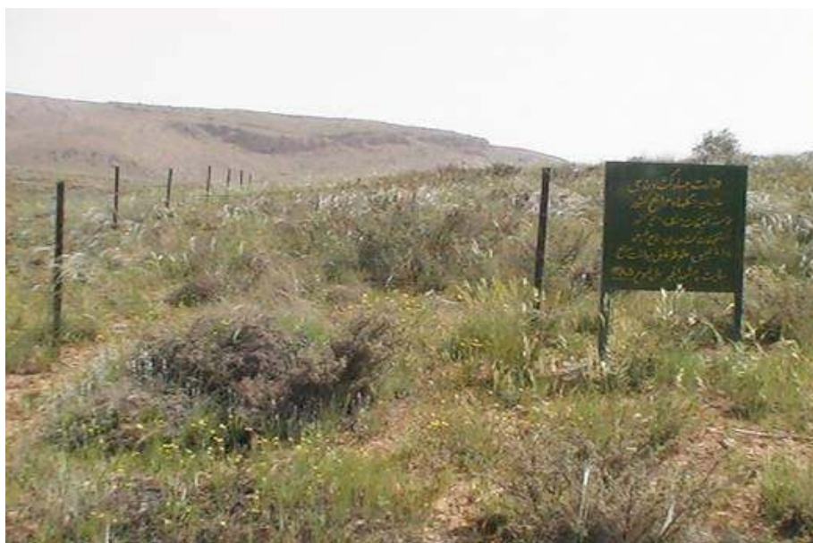
شکل ۱- نمایی از سایت چشمه‌انجیر استان فارس

ارزش رجحانی دارد. Sharifi و همکاران (۲۰۱۷) در مطالعه رفتار چرای دام و رابطه آن با تخریب مراتع نیمه‌استپی استان اردبیل بیان کردند در اوایل فصل رویش که معمولاً گیاهان به فراوانی یافت می‌شوند، تحرک دام کمتر است و اثر تخریبی کمتری دارد، از این رو به نظر می‌رسد هرچه علوفه در مرتع کمتر شود تحرک دام بیشتر شده و دام‌ها به‌ویژه دام سبک جستجوی بیشتری برای پیدا کردن علوفه صرف خواهد کرد و این مسئله باعث تخریب بیشتر مرتع می‌شود؛ بنابراین چرا در مواقع خشک‌سالی به دلیل کاهش تولید علوفه به افزایش تحرک دام در مرتع منجر شده و مرتع بیشتر صدمه‌دیده و فرسایش تشدید می‌شود. همچنین Ehsani و همکاران (۲۰۱۵) رفتار چرای گوسفند را در شیب‌های مختلف در مراتع نیمه‌استپی مطالعه کردند. آنان بیان کردند که در طی ماه اول فصل چرا هم‌زمان با دوره گلدهی گیاهان و در زمانی که پوشش گیاهی بیشتر است، دام به دلیل تنوع طلبی مسافت بیشتری را طی می‌کند و کمترین مسافت طی شده در ماه‌های مرداد و شهریور می‌باشد. Karimi و همکاران (۲۰۱۴) رفتار چرای گوسفند نژاد فشنندی را در مراتع سایت کردان (هشتگرد کرج) بشرح ذیل بیان کردند: طی ماه اول فصل چرا و در زمانی که پوشش گیاهی بیشتر می‌باشد، مسافت پیموده شده