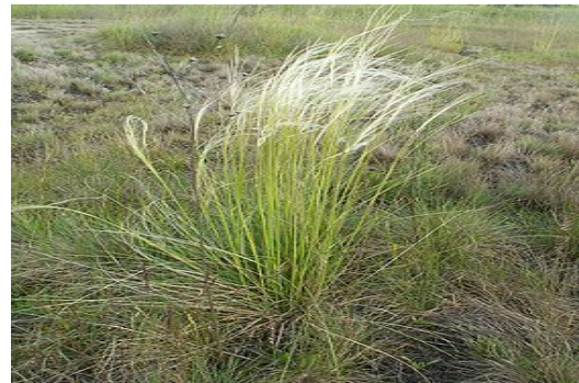
شکل ۱- گونه Stipa Arabica

شدن گیاه بقیه علوفه نیز چیده و توزین گردید که با جمع کردن علوفه حاصل از ماه‌های برداشت با باقیمانده تولید در پایان فصل رویش مقدار کل علوفه تولید شده گیاه در آن سال بدست آمد. درنهایت میزان تولید و شادابی پایه‌های انتخابی بر اثر تیمارهای بهره‌برداری اعمال شده در هر سال بررسی و ثبت شد. به‌منظور سنجش شادابی در مراحل مختلف رویشی هر پایه مورد بررسی قرار گرفته و عددی بین ۱ تا ۱۰، با توجه به میزان شادابی هر پایه، به آن اختصاص داده شد که درنهایت با توجه به اعداد کسب شده در مراحل مختلف رویشی، یک عدد به‌عنوان شاخص شادابی گیاه در آن سال ثبت گردید. میزان کل علوفه تولیدی و شادابی با آزمایش فاکتوریل در قالب بلوک‌های کامل تصادفی با ده تکرار و به مدت چهار سال در نرم افزار SAS مورد تجزیه و تحلیل قرار گرفت و میانگین صفات مورد بررسی با آزمون دانکن مورد مقایسه قرار گرفتند.