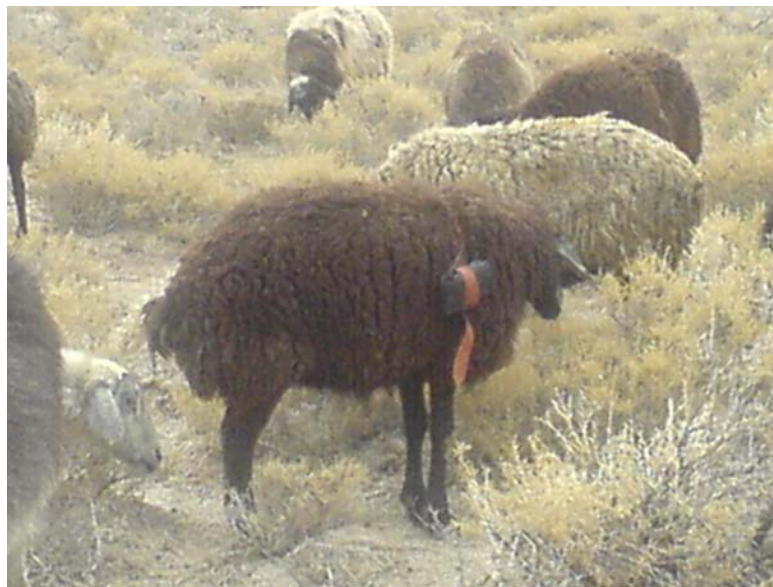
وا ندب ب GPS رلحاا ه و حنا و (هالس مس شیه) ه لشت بلختنا وا - ۶ لاش

ردلب هقبله دعب و ه لشت هتخلس DEM 4 زلفتا ارجمه قی راده وا رلتف رولنه هشقا و وا تخره بیسه رقلتا لب .دی یخ .له آتسد لب هبیش سمللا زانفا یه و