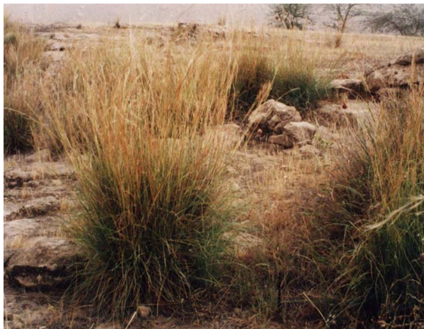
شکل ۲- گونه مرتعی نریشت Hyparrhenia hirta در مرحله ریزش بذر