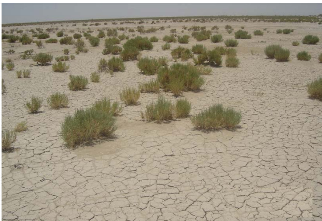
عکس ۳- پایه‌هایی از گونه شورپسند Halocnemum strobilaceum با اندام‌های گوشتی در دوره خشکی