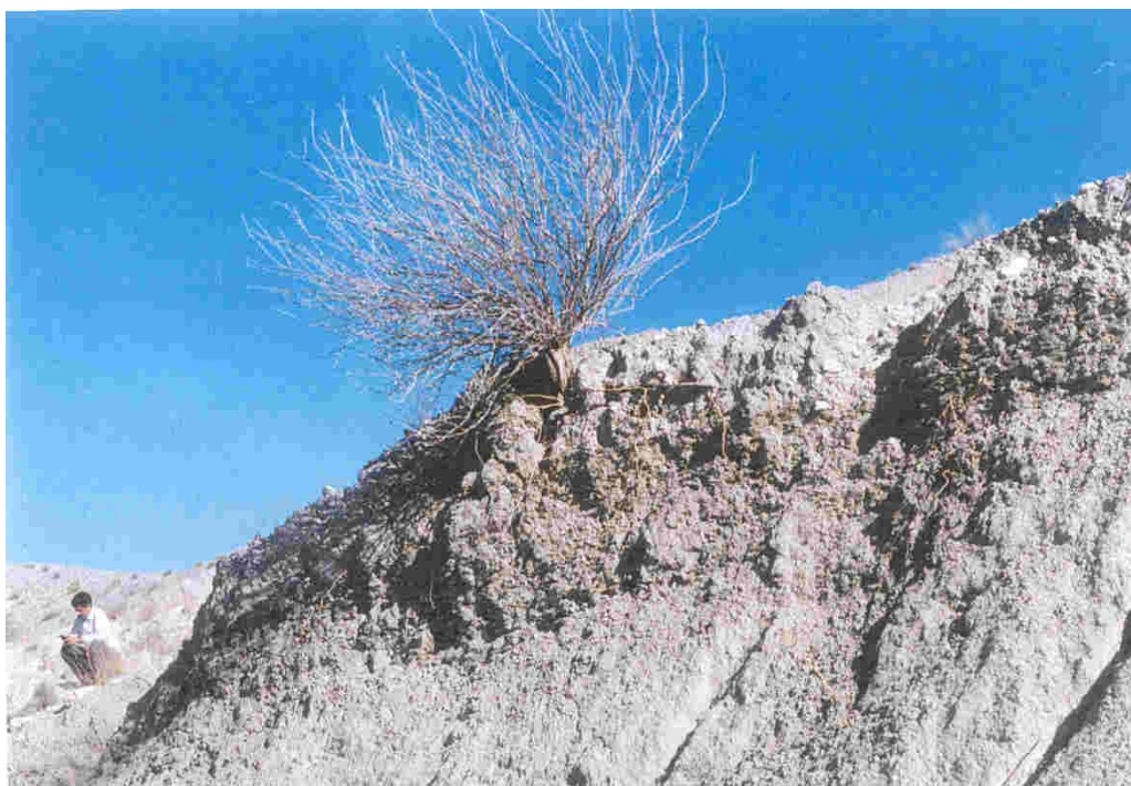
عکس ۴- خزان کامل گونه Zygophyllum atriplicoides و آب کشیدگی اندام‌های هوایی گیاه