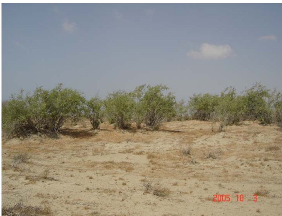
عکس ۲- پایه‌هایی از Salvadora persica با سرسبزی و شادابی در دوره خشکی به علت فتوسنتز خاص