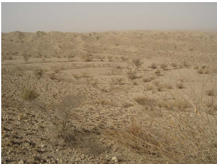
عکس ۱- Acacia oerfota و Acacia ehrenbergiana و خزان پایه‌ها در دوره خشکی