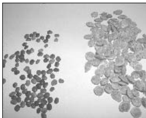
شکل ۶- تجدید حیات Hedysarum kopetdaghi

وزن هزاردانه بذرها بدون غلاف ۱۳/۴۳ تا ۱۵/۲۷ گرم و با غلاف ۱۹/۸۷ تا ۲۳/۱۷ گرم می باشد (شکل ۷). این گونه دارای قوه نامیه بیش از ۹۰ درصد است. معمولاً ۷۸٪ بذرهای جمع آوری شده سالم و حدود ۲۲٪ آنها پوک می باشند که این عامل احتمالاً در اثر حمله حشرات و همچنین عدم تلقیح مناسب می باشد.