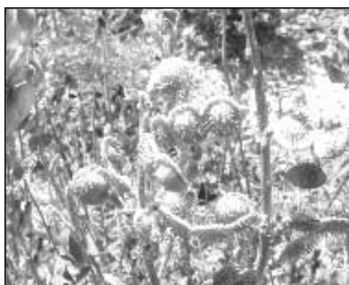
شکل ۴- مرحله گلدهی Hedysarum kopetdaghi