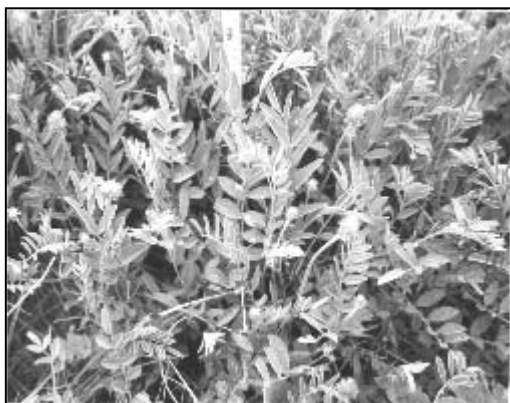
شکل ۶- مرحله رشد رویشی Hedysarum kopetdaghi

این گونه مرتعی عمدتاً از طریق بذر تجدید حیات می نماید (شکل ۶). بذره‌های ریخته شده در پای بوته‌ها بعد از سپری شدن سرما و معمولاً در اسفند ماه جوانه می زنند. بررسیها نشان داد که بذرهایی که در زیر بوته‌ها قرار می گیرند نسبت به بذرهایی که در فاصله بین بوته‌ها واقع می شوند از شرایط مناسب‌تری برای جوانه زنی برخوردار هستند و درصد بیشتری از آنها جوانه می زند. در واقع بعد از بارندگیهای زمستانی، خاک نرم و مرطوب اطراف گیاه محیط مناسبی برای رشد و نمو بذرها ایجاد می کند. با گرم شدن تدریجی هوا و خشکی تابستان بسیاری از نهالهای جوان خشک شده و از بین می روند که دلیل آن احتمالاً کمبود رطوبت و رقابت نهالهای جدید این گیاه با گیاهانی است که قبلاً استقرار یافته و ریشه‌های عمیق ایجاد کرده اند. با وجود تولید بذر فراوان و جوانه زدن آنها در پای بوته‌ها، تعداد اندکی از نهالها به رشد خود ادامه داده و به گیاه کامل تبدیل می شوند. همچنین با توجه به پایا بودن این گیاه، معمولاً در اواخر بهمن و اوایل اسفندماه جستهای رویشی گیاه فعال شده و شروع به رشد می نمایند.