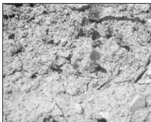
شکل ۷- بذر با غلاف و بدون غلاف Hedysarum kopetdaghi

نتایج حاصل از تجزیه شیمیایی گیاه Hedysarum kopetdaghi نشان داد که میزان پروتئین خام در مرحله رشد رویشی، گلدهی و رسیدن بذر به ترتیب برابر با ۲۷/۷۰، ۲۰/۶۷ و ۱۳/۰۶ درصد بوده که این میزان پروتئین خام برای تغذیه دام قابل ملاحظه می باشد (جدول ۲).