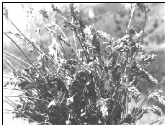
شکل ۵- مرحله تشکیل غلاف Hedysarum kopetdaghi