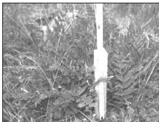
شکل ۳- مرحله ظهور غنچه Hedysarum kopetdaghi

این گونه مرتعی عمدتاً از طریق بذر تجدید حیات می نماید (شکل ۶). بذره‌های ریخته شده در پای بوته‌ها بعد از سپری شدن سرما و معمولاً در اسفند ماه جوانه می زنند. بررسیها نشان داد که بذرهایی که در زیر بوته‌ها قرار می گیرند نسبت به بذرهایی که در فاصله بین بوته‌ها واقع می شوند از شرایط مناسب‌تری برای جوانه زنی برخوردار هستند و درصد بیشتری از آنها جوانه می زند. در واقع بعد از بارندگیهای زمستانی، خاک نرم و مرطوب اطراف گیاه محیط مناسبی برای رشد و نمو بذرها ایجاد می کند. با گرم شدن تدریجی هوا و خشکی تابستان بسیاری از نهالهای جوان خشک شده و از بین می روند که دلیل آن احتمالاً کمبود رطوبت و رقابت نهالهای جدید این گیاه با گیاهانی است که قبلاً استقرار یافته و ریشه‌های عمیق ایجاد کرده اند. با وجود تولید بذر فراوان و جوانه زدن آنها در پای بوته‌ها، تعداد اندکی از نهالها به رشد خود ادامه داده و به گیاه کامل تبدیل می شوند. همچنین با توجه به پایا بودن این گیاه، معمولاً در اواخر بهمن و اوایل اسفندماه جستهای رویشی گیاه فعال شده و شروع به رشد می نمایند.