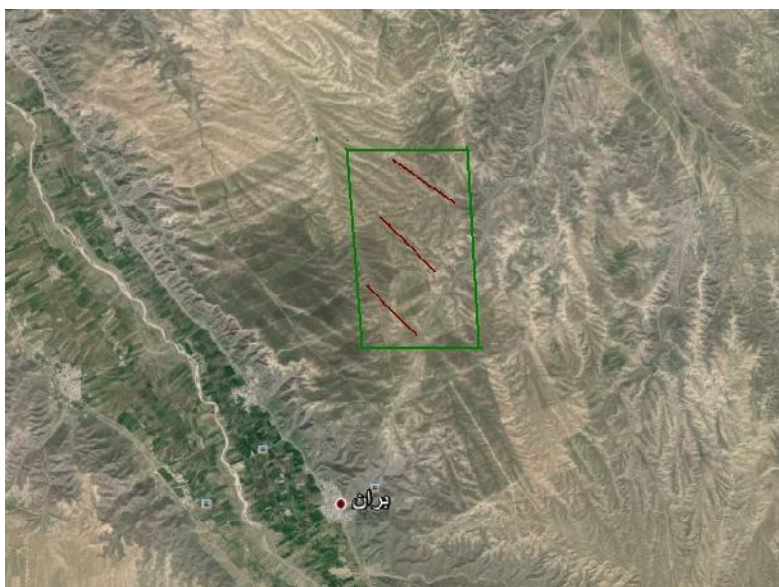
شکل ۲- موقعیت استقرار ترانسکت‌ها در سایت مطالعاتی مغان (مرتع قشلاقی بران)