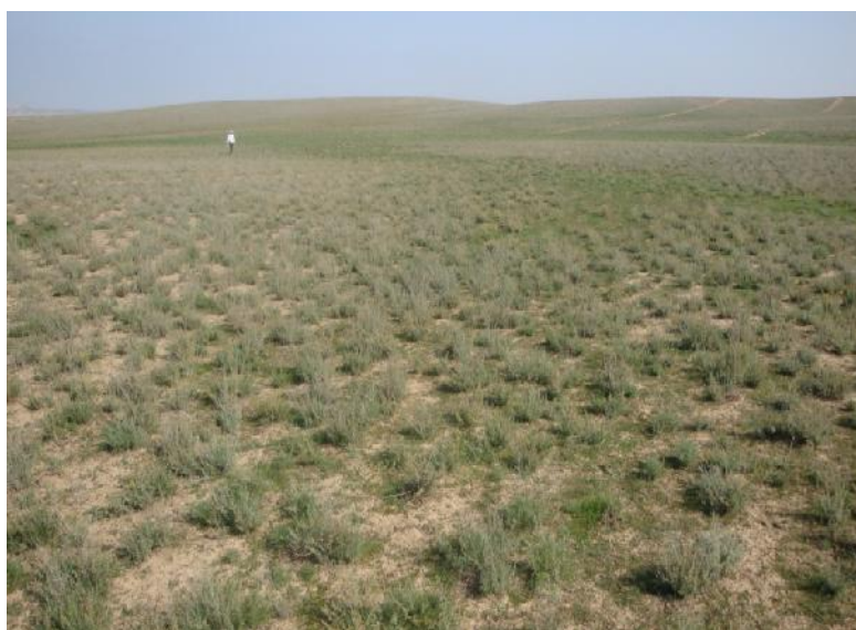
شکل ۳- تیپ گیاهی درمنه معطر ( Artemisia fragrans ) در مراتع مغان (قشلاقی بران، ۱۳۹۰)