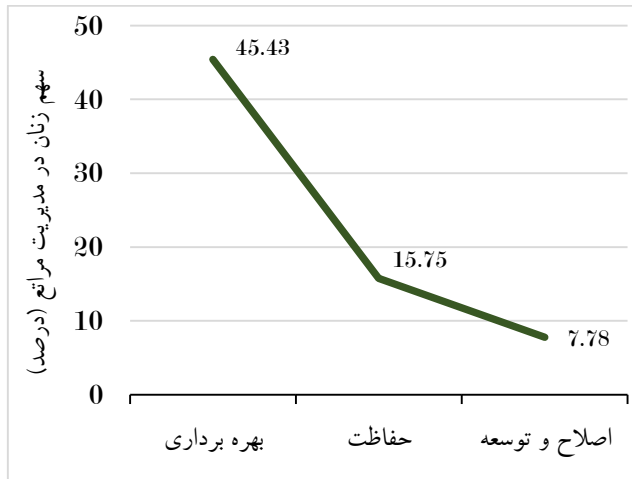
شکل ۱- سهم زنان در مدیریت مراتع برحسب نوع فعالیت

در شکل ۲، تغییرات سهم زنان در مدیریت مراتع بر حسب ماهیت کار بیان شد. در این نمودار زنان بیشترین مشارکت را در فعالیتهایی که به صورت خانوادگی انجام می‌شوند داشته و در بخش دوم در انجام فعالیتهای انفرادی سهم بالایی