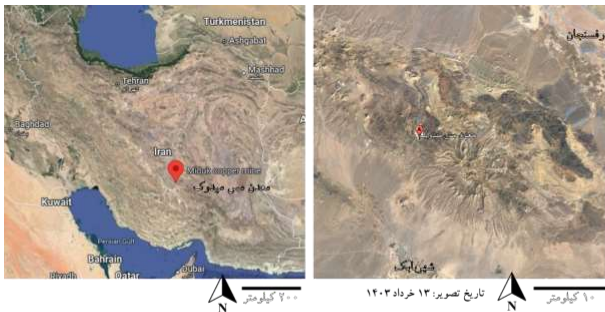
شکل ۱- موقعیت منطقه مورد تحقیق

شده و تا پاکستان امتداد می‌یابد. شیب نهایی معدن ۳۸ درجه، ارتفاع پله‌ها ۱۵ متر و شیب پله‌ها ۶۴ درجه می‌باشد. شهر بابک با مساحت بیش از ۲۶ کیلومترمربع در جنوب شرق ایران- ۵۵ درجه و ۸ دقیقه طول شرقی از نصف‌النهار گرینویچ و ۳۰ درجه و ۸ دقیقه عرض شمالی قرار دارد و دارای اقلیم معتدل خشک است. تابستان‌های نسبتاً گرم و با دوره گرمای کوتاه و شب‌های تابستانی خنک دارد، اما در زمستان‌ها بسیار سرد است. شهر بابک در دشتی مرتفع با ارتفاع ۱۸۴۵ متر از سطح دریا قرار گرفته است. میانگین دمای سالانه ۱۵/۱ درجه سانتی‌گراد و میانگین بارش سالانه ۱۶۳/۸ میلی‌متر، تعداد روزهای یخبندان سالانه ۹۰ روز می‌باشد. جهت غالب باد ۲۷۰ درجه با میانگین