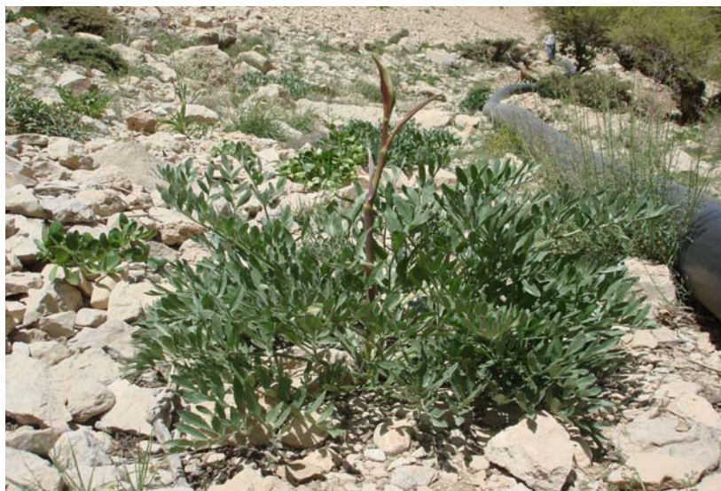
شکل ۲- گیاه Dorema aucheri در مرحله ظهور ساقه