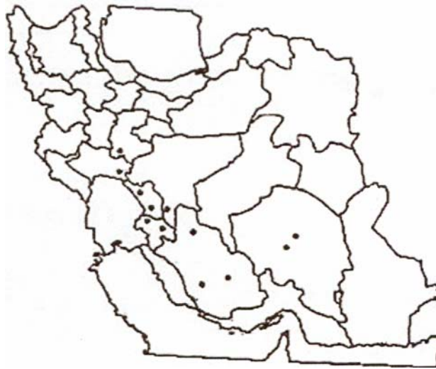
شکل ۳- پراکنش بیلهر در سطح ایران