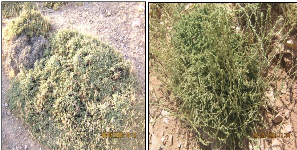
شکل ۲- گونه C. monspeliaca در حالت شاداب و برافراشته شکل ۳- گونه C. monspeliaca به حالت خوابیده و دفرمه